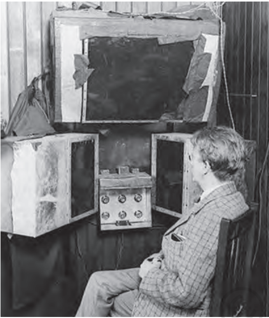
(यह यंत्र 'टेलीवाइजर', टेलीविजन का प्रारंभिक रूप था। अपने इस आविष्कार के सामने बैठे हैं— जॉन एल बेडी इस यंत्र के द्वारा उन्होंने रॉयल इंस्टीट्यूट के समक्ष अपने आविष्कार का प्रदर्शन किया था।

अपने प्रिय टी.वी. कार्यक्रम के दौरान विज्ञापित होने वाली तीन चीजों की सूची बनाइए।