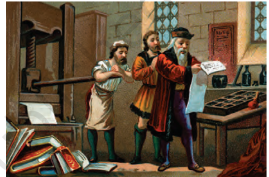
एक चित्रकार की नज़र में बाइबल के पहले पन्ने की छपाई करते हुए गुटेनबर्ग

पृष्ठ 64 पर दिए गए कोलाज में से संचार माध्यमों के छह अलग-अलग प्रकारों को छाँटिए।